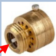
Válvula antirretorno SIN drenaje automático